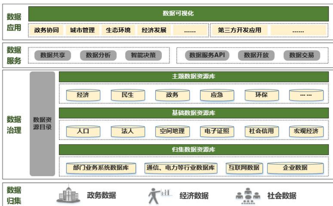
图 3-3 叶集区新型智慧城市数据架构

数据资源是新型智慧城市的核心资源，是开展城市智慧化应用的必要前提。统筹建设叶集数据湖，整合分布在政府部门、企业、社会和互联网上的各类信息资源数据，推动数据汇聚共享，为实现“智慧叶集”提供实时智能的数据支撑服务。按照“全省一盘棋”的思路，与省、市实现数据资源共享、协同联动。