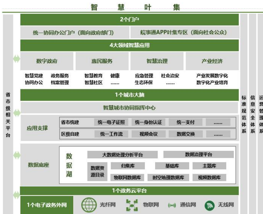
图 3-1 叶集区新型智慧城市总体架构

面向数字政府、惠民服务、智慧治理和产业经济四大应用领域的各项重点工程和各类智慧应用。